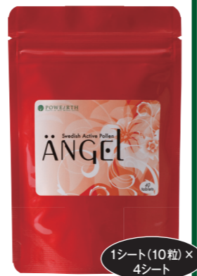
1シート(10粒) × 4シート

パワース スウェーディッシュ アクティブポーレン アンゲル ビジネス会員価格: 5,400円 4,000ポイント プロトン倶楽部(愛用会員): 5,832円 / 希小売価格: 7,020円