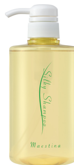
マエスティーナ シルキーシャンプー 500mL

ビジネス会員価格 5,500円 4,000ポイント プロトン倶楽部(愛用会員) 5,940円 希望小売価格 7,150円