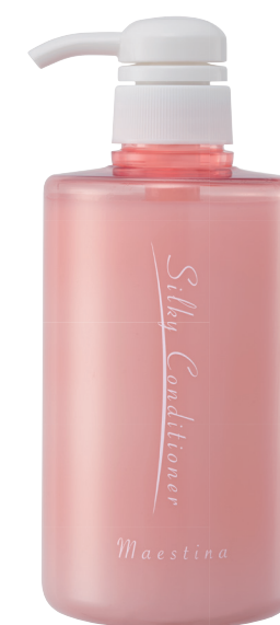
マエスティーナ シルキー コンディショナー 500mL

ビジネス会員価格 5,500円 4,000ポイント プロトン倶楽部(愛用会員) 5,940円 希望小売価格 7,150円