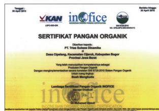
▲ 無農薬・有機栽培の証

そのインドネシア産の天然ノニ100%のフレッシュジュースに、酸味と甘みのバランスがとれたパイナップルとブドウの果汁や、カロリーゼロの甘味料である羅漢果(ラカンカ)エキスを加えて味を調整しています。ノニ本来の味を損なうことなく美味しい仕上がりになっていますので、安心してお召し上がりいただけます。