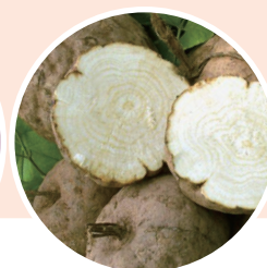
プエラリア ミリフィカ根