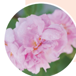
ブルガリアン ローズ

黒酵母を培養して得られた成分で、βグルカンと同様の物質であることが判明しています。絡み合った複雑な構造により、有害物質を吸着・排出する働きがあります。