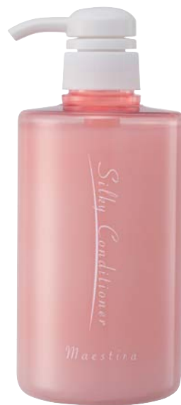
マエスティーナ シルキー コンディショナー 500mL

また、トウキンセンカ花エキスやヒキオコシ葉/茎エキスなど8種類のハーブエッセンスが、髪本来のツヤとコシを引出し、潤いを与え、生き生きとした仕上がりしてくれます。さらに進化したプロトン ストラクチャードウォーターが髪の補修と保護をサポートします。防腐剤や蛍光剤も不使用です。毎日のヘアケアにどうぞご愛用ください。