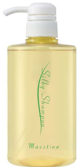
マエスティーナ シルキーシャンプー 500mL

ビジネス会員価格:5,400円 4,000ポイント プロトン倶楽部(愛用会員):5,832円 / 希望小売価格:7,020円