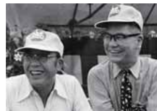
本田宗一郎(左)と藤澤武夫(右)