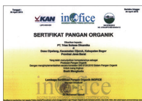
▲ 無農薬・有機栽培の証

ノニフォルテ プラスには、ノニの原産地でもあるインドネシアで無農薬・有機栽培された果実のみを使用しています。インドネシア産のノニ果実は、他の産地のもの比べて果実がとても大きく、栄養価が高いのが特長です。ノニ独特の匂いが苦手という方もいますが、その原因は熟れすぎた果実から出る腐敗臭です。それを防ぐため、新鮮な緑色の果実を現地で搾汁し、フレッシュジュースの状態での輸入しています。