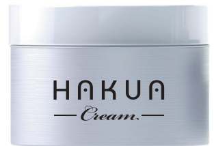
※製品イメージイラスト

2024年春、待望の新製品『HAKUAクリーム』が新発売となります! フルボ酸をたっぷり使い、乾燥性敏感肌の方や赤ちゃんにも使用できる高品質のワセリンを配合(アレルギーテスト済)。 適量を肌に塗布してご使用いただければ、肌に有効な成分が補給され、肌状態が改善されていきます。詳しくは次号で!!