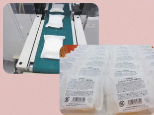
⑤ピロー包装し、シールを貼ります