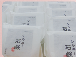
⑥最後は丁寧に箱詰めです

今回は、新春ご愛顧感謝として、通常2個セットのシルキー石鹸を4個セットで、お値段据え置き！ 実質半額にてご提供いたします。