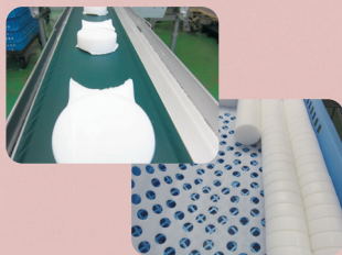
④コンベアで移動し、余分なバリなどを丁寧に研磨