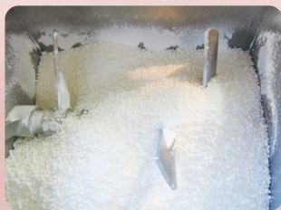
①セッケン素地や添加剤などを混ぜ合わせます