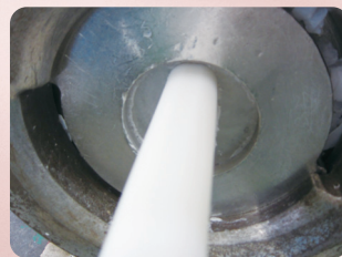
③必要な重量分だけ棒状に押し出します