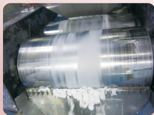
②そして有効成分を加え、十分に練り込みます